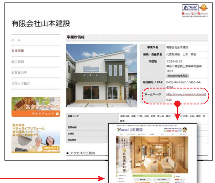
施工事例を含む全6コンテンツを掲載